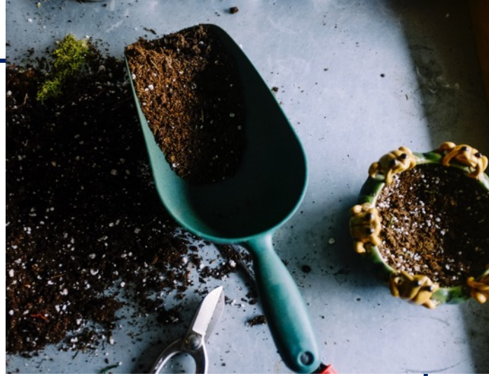
Unser Nährboden - Das steckt in uns

Kein geringeres Ziel als gemeinsam im Team und besonders im Füreinander unseren Gästen ein Mehr an Aufmerksamkeit, Wohlbefinden & bereichernden Erinnerungen schenken zu können. Als starkes Team teilen wir die gleichen Werte sowie den Glauben daran, mit passenden Umfeldern Menschen und Organisationen bei ihrer Entfaltung zu unterstützen.