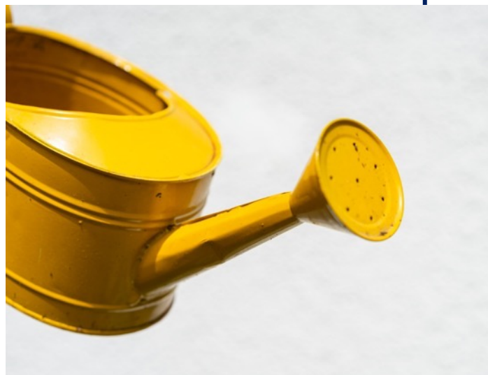
Unser Wachstumsfaktor – Potentialentwickler

Den Director (m/w/d) für unseren neu geschaffenen Bereich Talents & Culture. Du begleitest unsere Mitarbeiter auf ihrer Reise durch unser Unternehmen, stärkst die Gemeinschaft und hältst mit Aus- und Weiterbildungsmanagement unser Niveau oben. Neben der Überwachung arbeitsrechtlicher Vorschriften bekommst Du Gestaltungsmöglichkeiten in der Konzeptionierung und Begleitung von Mitarbeiter- und Führungskräfteentwicklungsprogrammen.